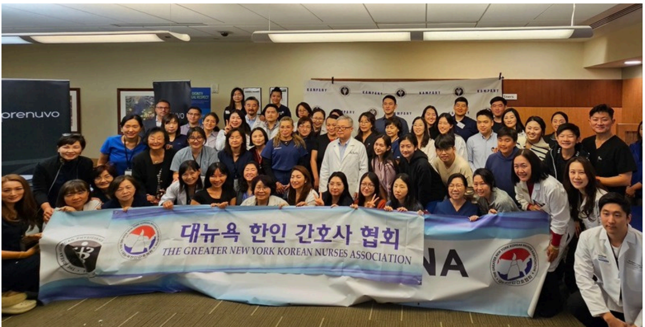
무료건강 검진 단체사진