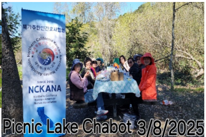
Picnic Lake Chabot 3/8/2025