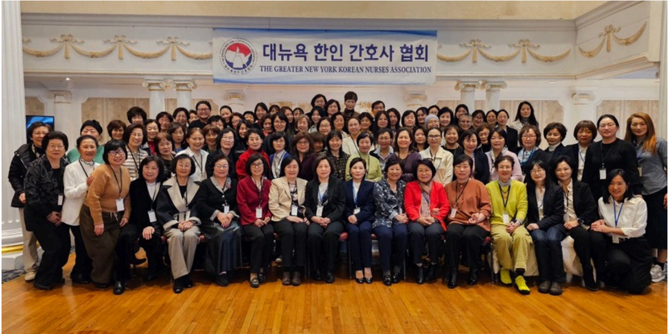
42대 정기총회 단체사진