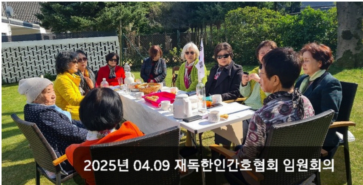
2025년 04.09 재독한인간호협회 임원회의

*2025 나이팅게일 탄신 기념 ●건강, 문화 행사 초청 안내 재독한인간호협회는 나이팅게일의 정신을 되새기며 회원분들의 건강과 교류를 나누는 다양한 프로그램을 아래와 같이 개최합니다.