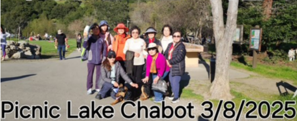
Picnic Lake Chabot 3/8/2025